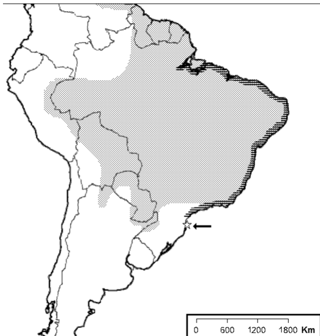
Figura 3 - Distribuição da saíra-de-chapéu-preto, Nemosia pileata (Boddaert, 1783), (área sombreada) e porção costeira e ao sul do Amazonas da distribuição da figuinha-do-mangue, Conirostrum bicolor (Vieillot, 1809), (área tracejada). A estrela branca indica o novo local de ocorrência para ambas as espécies. Distribuições com base em Narosky & Yzurieta (1987), Ridgely & Tudor (1989), Belton (1994) e Scherer-Neto & Straube (1995), construídas sobre mapa base do Arizona Geographic Alliance.