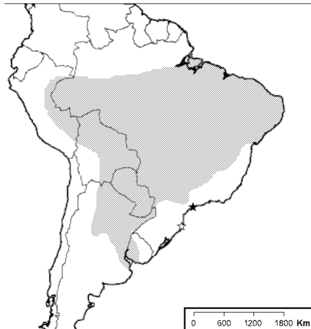
Figura 4 - Distribuição da lavadeira-de-cara-branca, Fluvicola albiventer (Spix, 1825), (área sombreada). A estrela preta indica o local de ocorrência no litoral de São Paulo (Olmos & Silva e Silva 2001, 2003); a estrela branca indica o novo local de ocorrência para a espécie no litoral de Santa Catarina. Distribuição com base em Narosky & Yzurieta (1987), Ridgely & Tudor (1994), Scherer-Neto & Straube (1995) e Willis & Oniki (2003), construída sobre mapa base do Arizona Geographic Alliance.

em frutificação, num jardim residencial, à margem da rua, na Praia da Solidão, Ilha de Santa Catarina, (c. 27° 48' S e 48° 32' W).