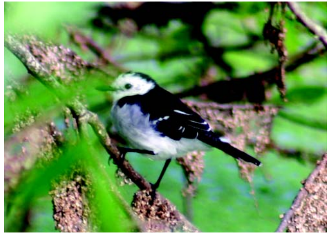
Figura 1 - Indivíduo de lavadeira-de-cara-branca, Fluvicola albiventer (Spix, 1825), fotografado em Santa Catarina em 22/IV/2005.

Nemosia pileata (Boddaer, 1783), Emberizidae (saíra-de-chapéu-preto) — Em 17 de junho de 2004, uma fêmea foi fotografada enquanto forrageava numa aroeira ( Schinus terebinthifolius , Anacardiaceae) de porte pequeno (aprox. 3 m)